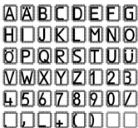
Tastbare Schrift nach ÖNORM V 2105 (Anhang A)

Menschen mit Behinderungen haben im Alltag oft mit Problemen zu kämpfen, die sich mit geeigneten Hilfsmitteln besser bewältigen lassen. Welches Mittel welchen Anforderungen am besten gerecht wird, ist Thema der ÖNORM EN ISO 9999, die in der Neuausgabe eine Klassifikation der verschiedenen Hilfsmittel nach ihrer Funktion liefert – seien es Sonderanfertigungen oder Gebrauchsgüter. Die Klassifikation basiert auf drei Hierarchiestufen, wobei jeder Code aus drei zweistelligen Ziffern besteht. Neben der funktionalen Beschreibung und der eigentlichen Klassifikation finden sich im Anhang eine Konvertierungstabelle für die Änderungen zur Vorversion von 2007 sowie ein alphabetischer Index, um Anwendung und Zugänglichkeit zu verbessern. Die aktuelle Ausgabe umfasst etwa 980 Benennungen, von denen ca. 90 neu sind und sich rund 500 geändert haben. Die wesentliche Änderung ist die Ergänzung der Klasse 28 „Hilfsmittel für Arbeitsplatz und Berufsausbildung“. Die neue Klasse umfasst Hilfsmittel, die hauptsächlich während der Arbeit oder der Berufsausbildung benötigt werden.