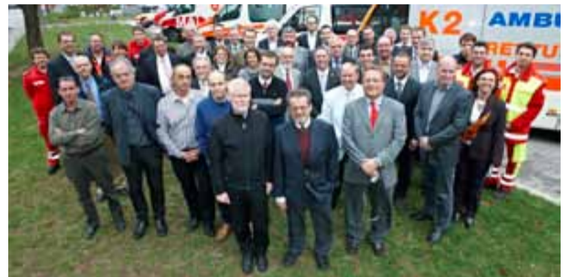
Experten aus ganz Europa kamen zum Meeting von CEN/TC 239/WG 1