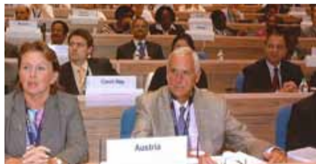
Die österreichische Delegation